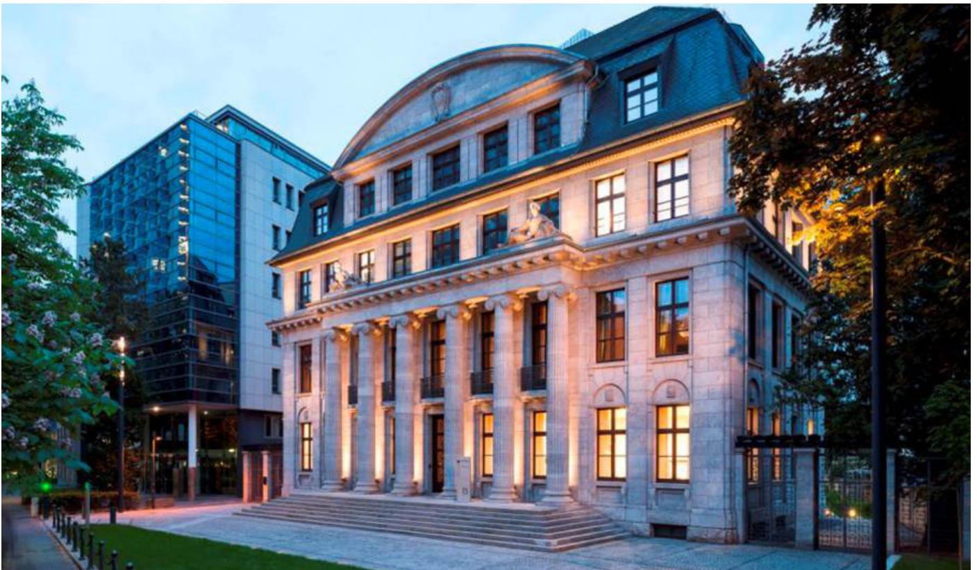
Arnold & Porter am Standort Bockenheimer Landstraße 25 in Frankfurt